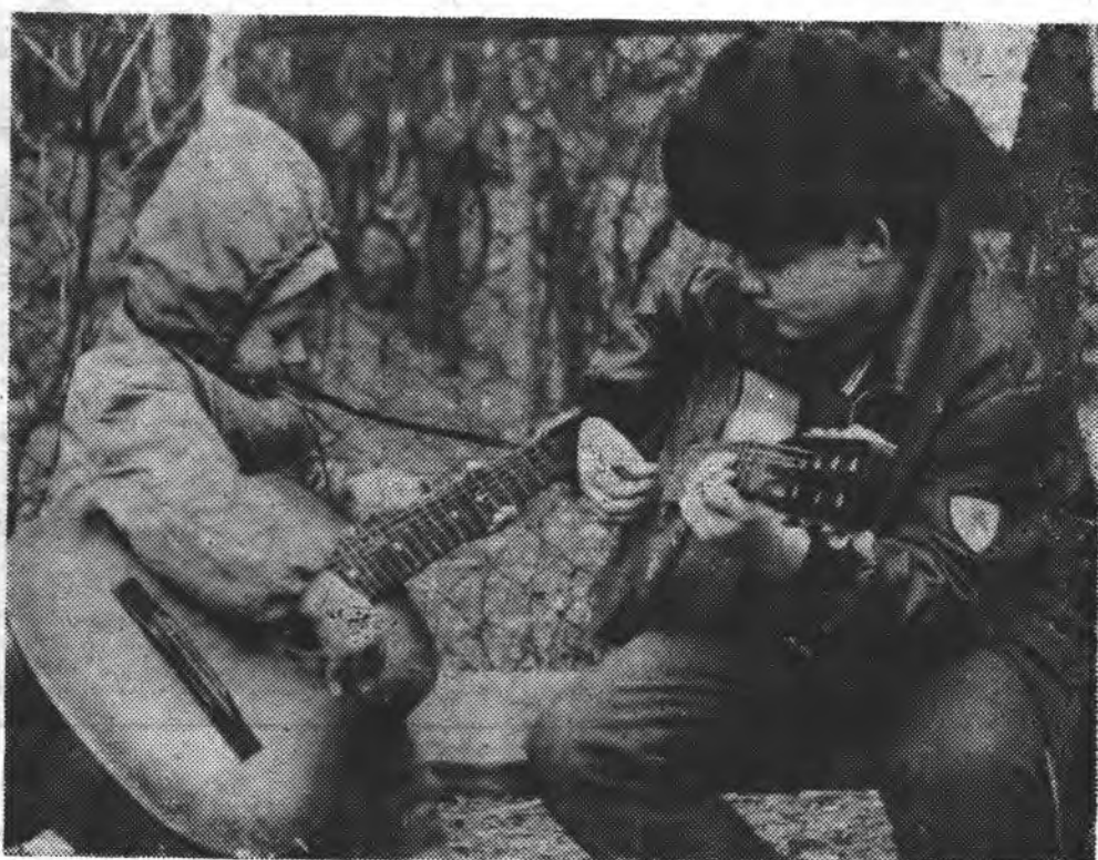
«ДАВАЙ ЗАГРАЄМО ДУ ЕТОМ...»

Протягом цього періоду удосконалювалася структура партійної організації,